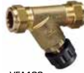
VFA100 Kompresyon fitting

ESBE doldurma vanaları, ısıtma sistemi ve diğer kapalı akışkan sistemlerinin doldurulmasında kullanılır.