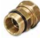
VDA100 Diş dişli

ESBE boşaltma vanaları kazanlar, sıcak su tankları borular ve benzeri yerlerde kullanılır. Hortum nipeline bağlandığında otomatik olarak açılır.