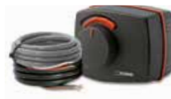
3 punti, interruttore ausiliario