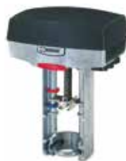
ALB100 3 points/proportionnel

Les servomoteurs ESBE de la série ALB sont spécialement conçus pour les applications nécessitant précision et vitesse élevées.