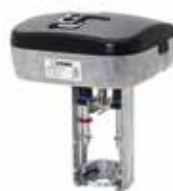
ALB100 3 punti/proporzionale

Gli attuatori ESBE serie ALB sono progettati specificatamente per le applicazioni ad alta risoluzione e velocità.