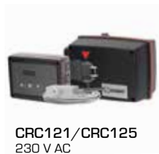
CRC121/CRC125 230 V AC

17053100 __ CRA911 Sensore del tubo di mandata, cavo da 5 m 98100690 _____ Interruttore ausiliario serie 90