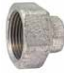
KTB100 Invändig gänga

ESBE koppelsatser för ventiler med utvändig gänga. En förpackning/port.