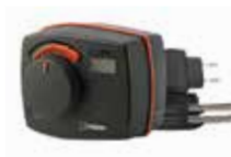
CRA141 230 V CA

17053100 _____ CRA911 Sonda de tubería de caudal, cable de 5 m