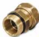
VDA100 Rosca externa

Válvulas de drenaje ESBE para calderas, tanques de agua caliente, tuberías, etc. Se abre automáticamente al conectar la boquilla del tubo.