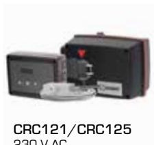
CRC121/CRC125 230 V AC

17053100 __ CRA911 Sensore del tubo di mandata, cavo da 5 m 98100690 _____ Interruttore ausiliario serie 90